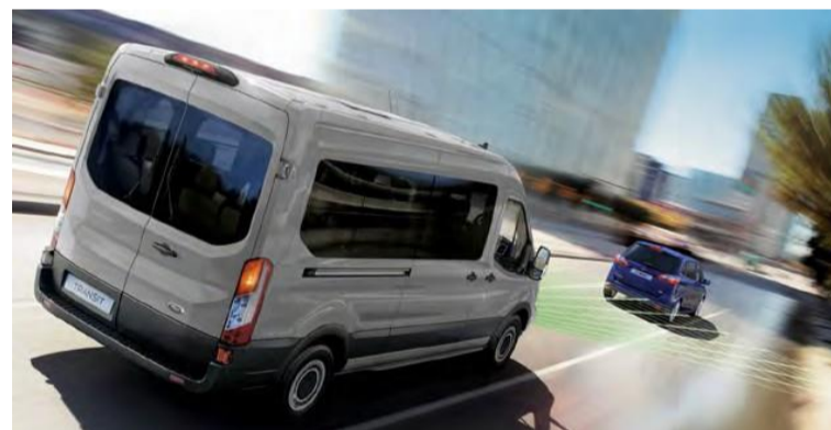
Tecnologias como Piloto automático adaptativo, Assistente de permanência em faixa e direção elétrica fornecem mais produtividade ao seu negócio.

Vidros Elétricos Dianteiros com sistema de abertura / fechamento com um toque para cima / baixo