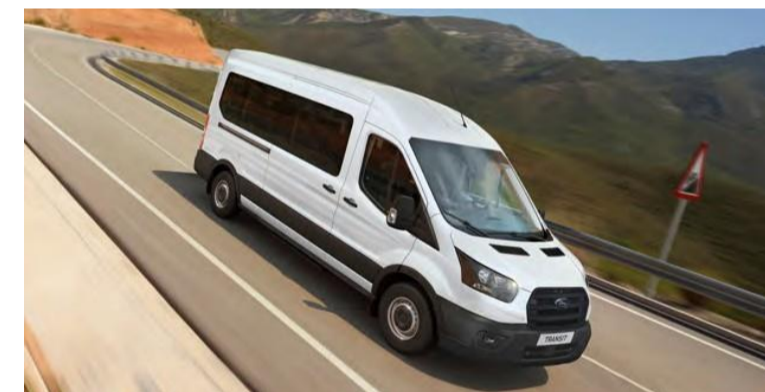
Pacote AdvanceTrac® que entrega mais segurança para o condutor e passageiros.