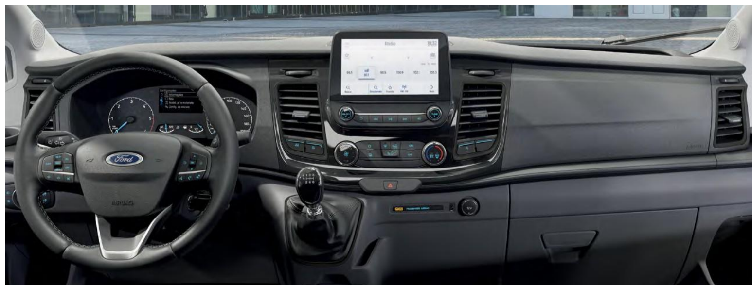
Mais conforto e dirigibilidade em conjunto com o Sync Move e com a opção de transmissão automática.