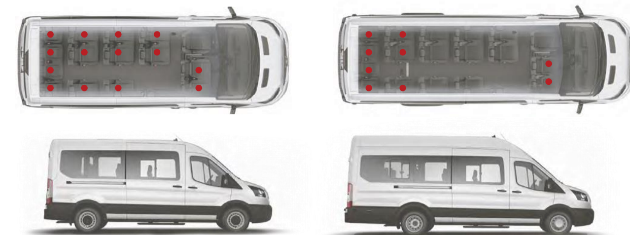
L3H2 versão Minibus com 14+1 lugares e versão Vidrada com 2+1 lugares