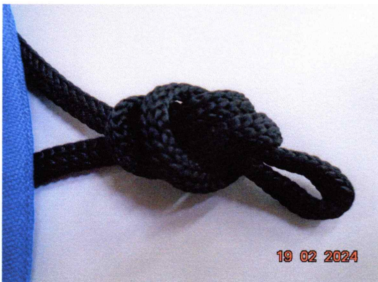
Imagem 2: Evidência de que o produto não atende ao descritivo: “sendo o ajuste por meio de cordão trançado 100% poliéster e regulador de plástico”.