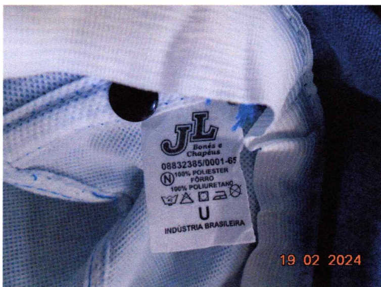
Imagem 1: Evidência de que o produto não atende ao descritivo: “material externo de brim 100% algodão”