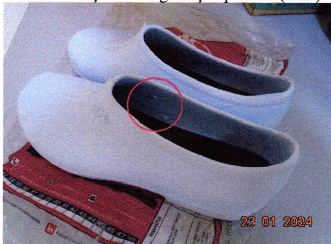
Imagem 3: Evidência de imperfeições na amostra disponibilizada, sendo estas, caracterizadas por material saliente na área interna.

Item 14 - Calçado de segurança tipo tênis (EVA):