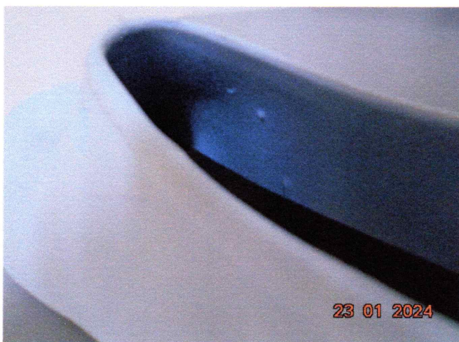
Imagem 4: Evidência de imperfeições

Imagem 3: Evidência de imperfeições na amostra disponibilizada, sendo estas, caracterizadas por material saliente na área interna.