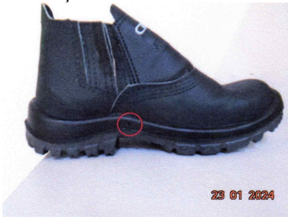
Imagem 1: Evidência de imperfeições na amostra disponibilizada, sendo esta caracterizada por bolhas orifício na área da sola.

Item 09 - Calçado de segurança botina - tipo B, biqueira em polipropileno para conformação: