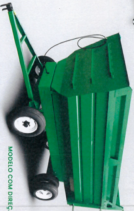
MODELO COM DIREÇÃO