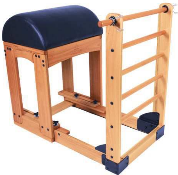
PA00671A - LADDER BARREL CLASSIC - ARKTUS Aparelho de Pilates Ladder Barrel Classic - Arktus